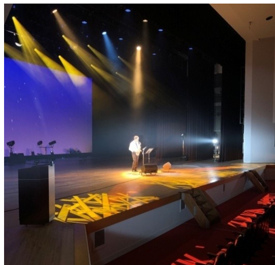
オープニング演奏